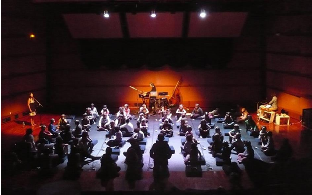
Les élèves de 3 ème sont allés voir L'Histoire de Clara à la salle polyvalente d'Ambrières.